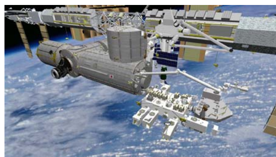
【国際宇宙ステーション(ISS)と日本実験棟】(JAXA)

日本実験棟「きぼう」が組み込まれる国際宇宙ステーション(ISS)の中の宇宙空間では、重力がほとんどゼロの状態となり、地上における浮遊・沈降(軽いものが浮き重たいものが沈む)あるいは対流と言った現象が起こらず、均一で静かな環境が実現します。この宇宙環境を利用して、高品質のタンパク質結晶をつくるのが可能となります。その結晶を地上に持ち帰り、タンパク質の構造を詳しく調べることができるのです。