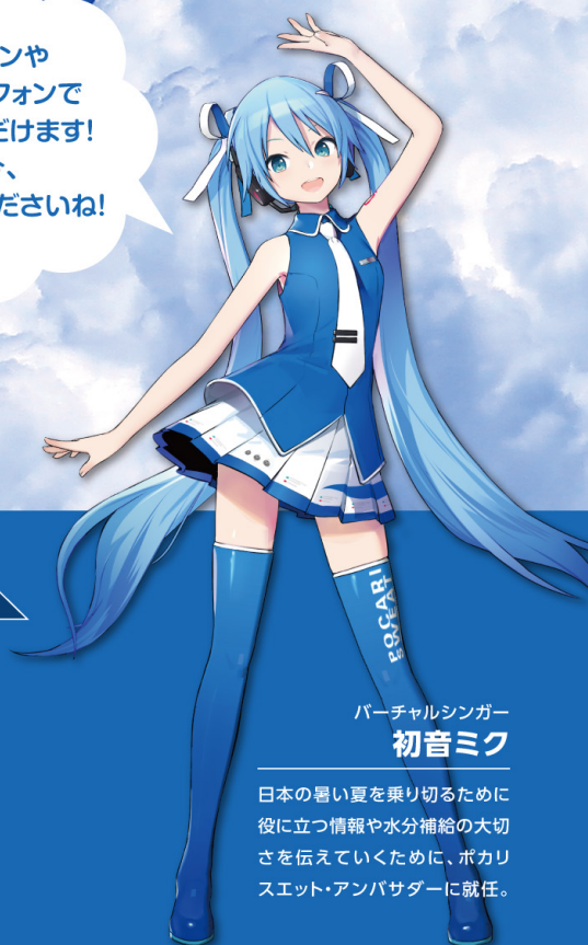
バーチャルシンガー 初音ミク

日本の暑い夏を乗り切るために 役に立つ情報や水分補給の大切 さを伝えていくために、ポカリ スエット・アンバサダーに就任。