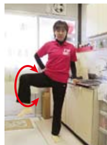
股関節のほぐし(膝を伸ばして・膝を曲げて・内回し外回し)