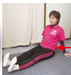
足首の曲げ伸ばし

じっとしていると足腰の血行が悪くなり、疲労や腰痛、むくみや冷えにつながります。意識して脚の血流改善を積極的に行いましょう!