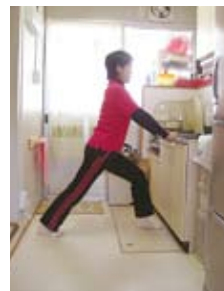
ふくらはぎ伸ばし