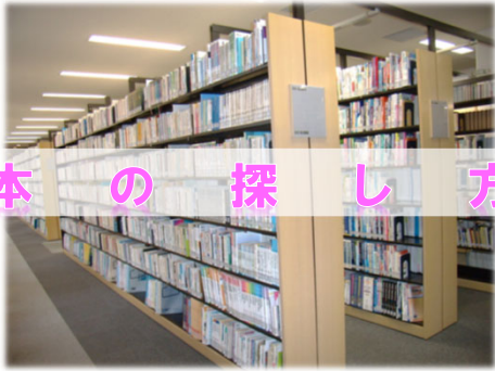
長崎国際大学図書館